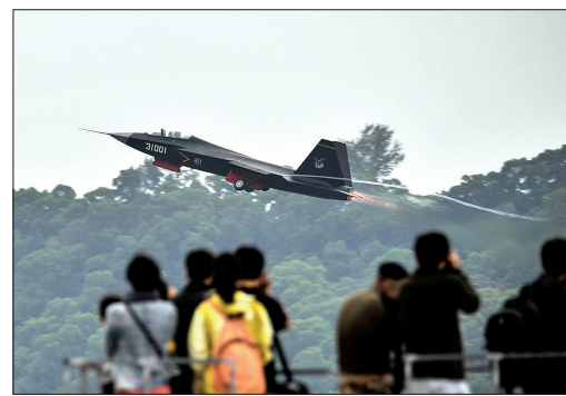
珠海航展明星机悉数亮相彩排

习近平强调,中央政府将继续坚定不移贯彻“一国两制”方针和基本法,坚定不移支持香港依法推进民主发展,坚定不移维护香港长期繁荣稳定。希望香港各界在行政长官梁振英和特区政府带领下,把握历史机遇,依法落实普选,共同谱写香港民主发展新篇章,保持香港社会稳定和广大市民安居乐业。