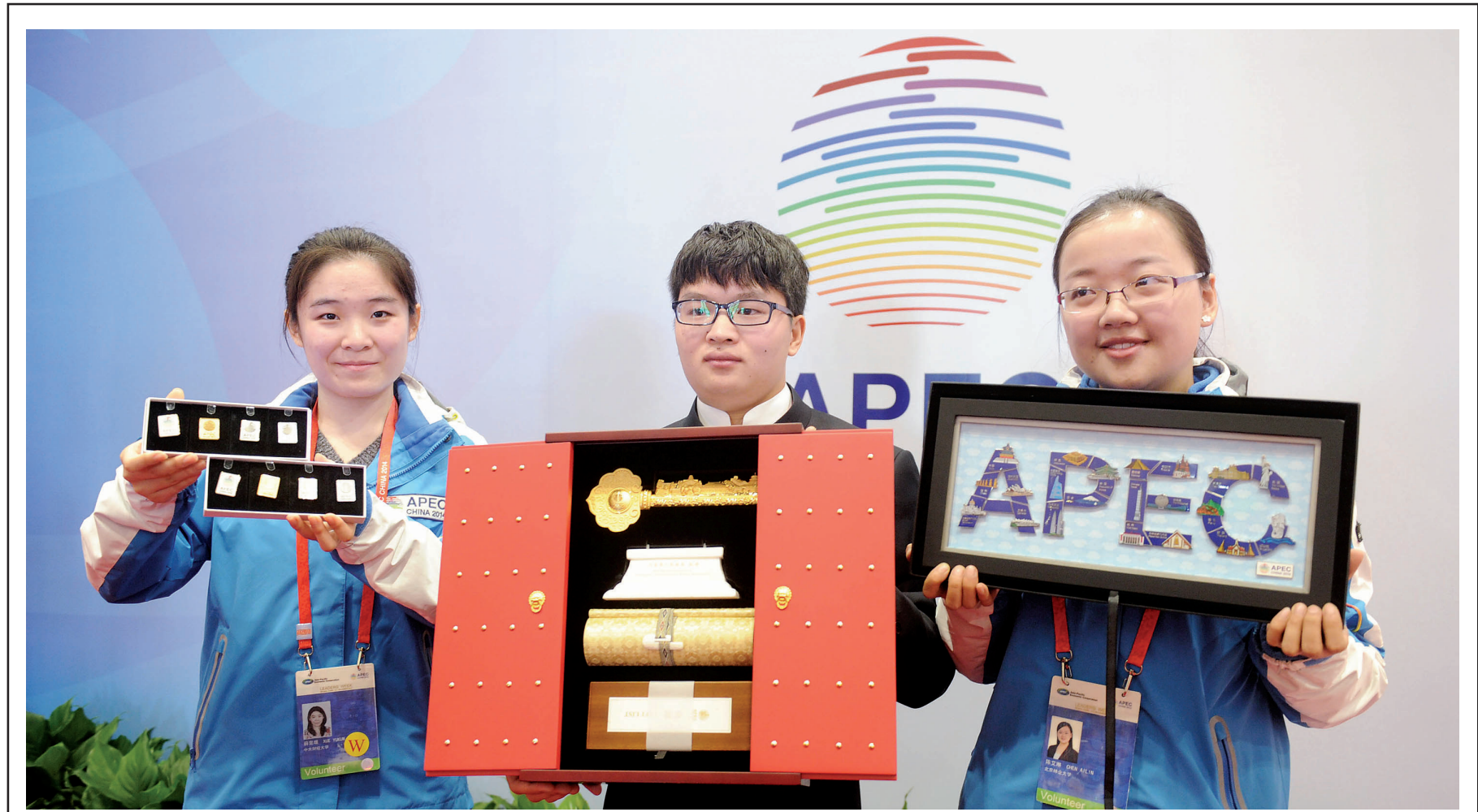
11月9日,志愿者展示APEC纪念徽章和一把合金城市钥匙

在11月11日即将开幕的第十届中国国际航空航天博览会上,中国火星探测系统将首次亮相。中国火星探测系统由环绕器和着陆巡视器组成,其中着陆巡视器主要功能为实现火星表面软着陆,并释放分离火星巡视器,开展巡视科学探索。