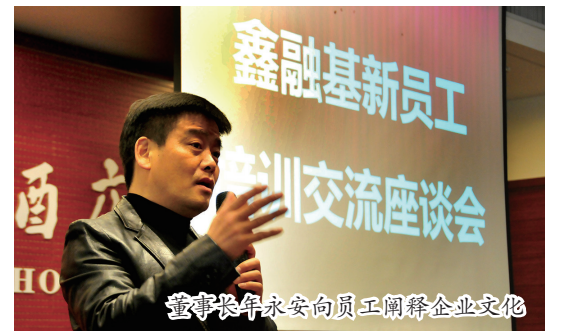
董事长永安向员工阐释企业文化