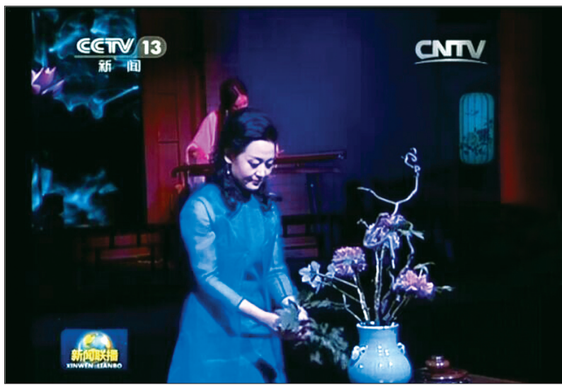
见证很多重要、美好的历史时刻。

“唯有牡丹真国色,花开时节动京城。”APEC会议在北京举行,中国走到了世界的聚光灯下,众多国家首脑和政要会聚北京。作为中国的国民之花、梦想之花、幸福之花的洛阳牡丹,将在APEC北京会议期间,笑迎国际贵宾,