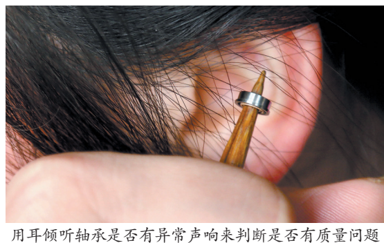
用耳倾听轴承是否有异常声响来判断是否有质量问题