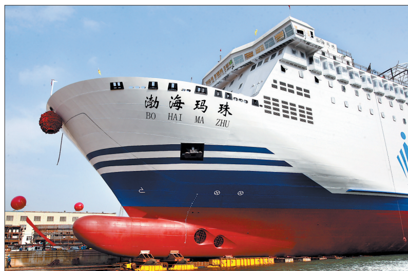
11月6日,“渤海明珠”轮徐徐下水

本报讯(记者 张锐鑫)依靠高可靠性能,河柴产品再添“最”。近日,渤海轮渡股份有限公司斥资近4亿元打造的亚洲最大、最豪华客滚船——“渤海明珠”轮,在位于山东省威海市的黄海造船有限公司船厂顺利下水。这个总吨位达3.5万吨的庞然大物所配备的应急电站装备,是河南柴油机重工有限责任公司生产的TBD234V8发电机组。 客滚船是指可使所载货物通过自身的动力进出货仓并同时载运旅客的船舶,多用于内河轮渡或者中近程海运。“渤海明珠”轮是“渤海明珠”“渤海晶珠”“渤海钻珠”轮的姊妹船,按照国际航行客滚船要求建造,计划明年投入大连与烟台间的航线运营。 “渤海明珠”轮配备了电梯,设有带落地窗、观光阳台的豪华客房,直升机可以直接降落,其豪华程度介于客滚船与豪华邮轮之间。该客滚船总长178.8米,型宽28米,总吨位为