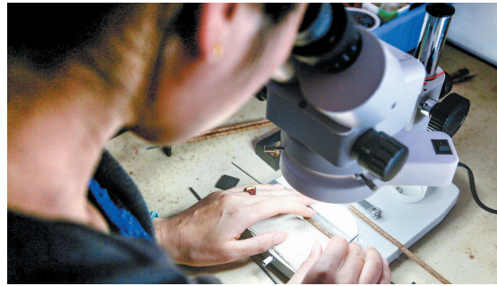
在显微镜下加工轴承