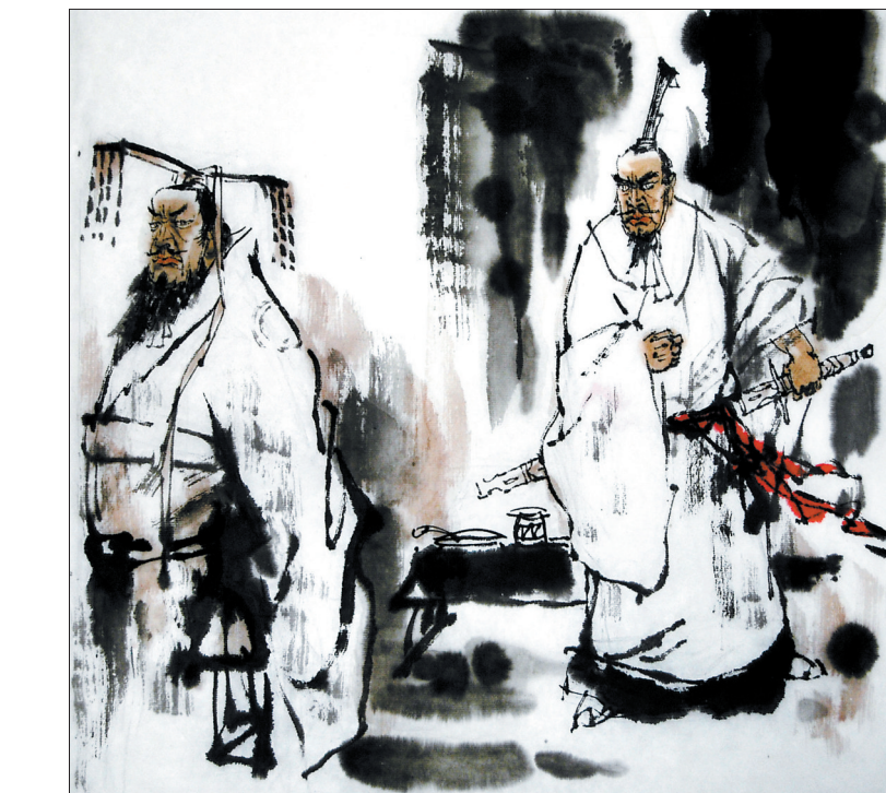
唐雎欲与秦始皇拼命