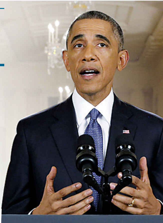
美国总统奥巴马就修改移民政策发表全国电视讲话

共和党参议员杰里·莫兰说:“据我所知,在司法程序之外,唯一应对这个的办法就是勒紧钱袋子。”(据新华社供本报特稿)