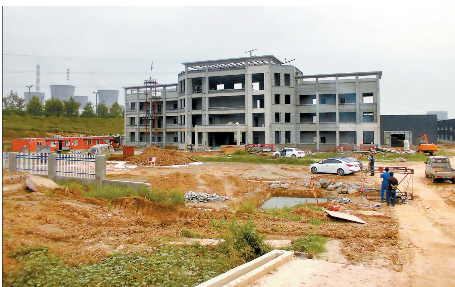
锐仕泽科技有限公司年产150吨复合材料项目加紧建设

乡”。今年8月14日,偃师市针织业协会在翟镇镇亮琪工业园成立,此举标志着偃师针织业发展从盲目生产、无序竞争迈入了行业自律、协同管理、共同提高、快速发展的新阶段。协会积极发挥引领作用,打破针织户小而散的格局,整合资源,变“手指”为“拳头”,由单打独斗向抱团集聚发展。目前,已有110多家针织企业和针织户加入了针织业协会。