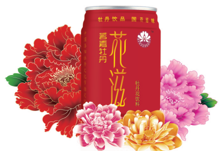
茗嘉牡丹花滋饮品