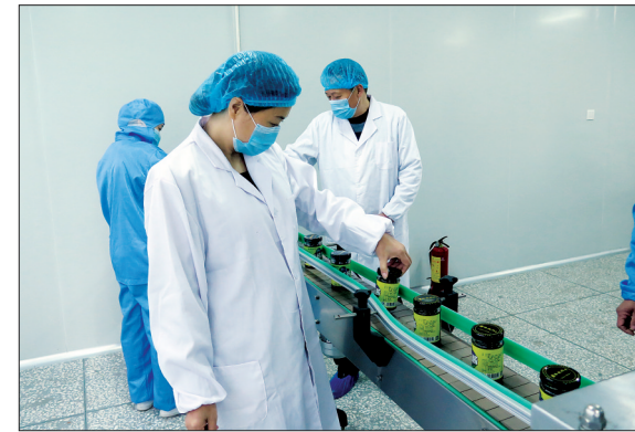
夫妻俩在食品罐装车间