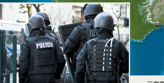
示意图 新华社记者 崔莹 编制