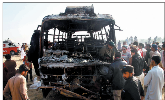
1月11日，在巴基斯坦卡拉奇，人们在车祸现场查看汽车残骸。