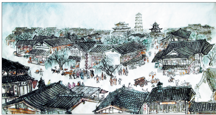
柳林街风物图 聂剑帆画

柳林街,洛阳老城东南隅的主街道。这条街道,一直是商业繁华之地,这里曾有大型集市和林立的店铺,是丝路文化和大运河文化的交汇点。它见证了老城东南隅的历史变迁,其中的故事值得人们去追寻。