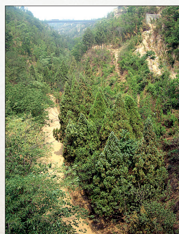
晋豫盐道遗址

每个州县的盐都是由政府指定的专商负责运输和销售的,这样一来,商人就通过行贿来取得专商资格。清乾隆五十七年(公元1792年)以后,政府对潞盐裁去专商,实行引无定商、销无定地,放开了潞盐销市场。这样,洛阳在晋豫盐道上的枢纽地位进一步加强,并形成辐射中原的潞盐贸易中心。