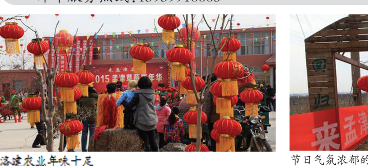
洛建农业年味十足

今年的孟津草莓嘉年华在规模和形式上都进行了突破,策划了一系列精彩活动。情人节“999束蔬菜鲜花,谁包谁走”活动让人眼前一亮,许多情侣在这里留下了浪漫的记忆;春节期间的民俗表演,也吸引了不少全家出游的朋友。现在,寻找草莓皇后暨最美草莓