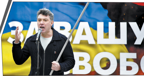
这是涅姆佐夫2014年3月15日在莫斯科出席集会活动的资料照片

涅姆佐夫现年55岁，曾在俄罗斯前总统鲍里斯·叶利钦当政时期担任过副总理，一度被认为是总统接替人选之一。他自2012年起担任反对党“俄罗斯共和党-人民自由党”联合主席，在2013年9月举行的地方选举中当选雅罗斯拉夫州杜马议员。枪杀事件发生前约两小时，涅姆佐夫刚刚接受了莫斯科回声电台采访。（据新华社电）