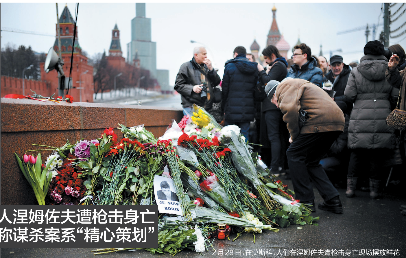
2月28日，在莫斯科，人们在涅姆佐夫遭枪击身亡现场摆放鲜花