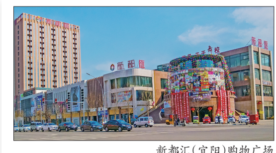
新都汇(宜阳)购物广场