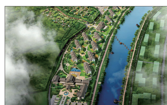
汉山老年养生基地效果图