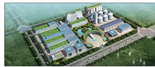
洛阳雪龙生态食品产业园效果图