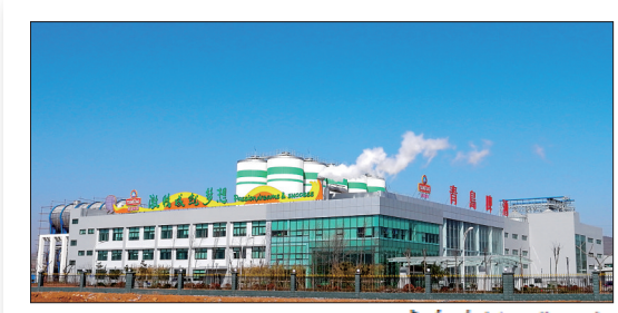
青岛啤酒一期工程