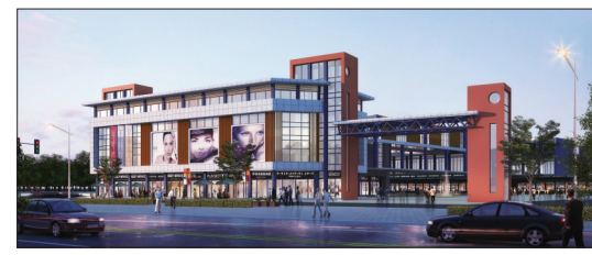
北城区农副产品物流中心效果图