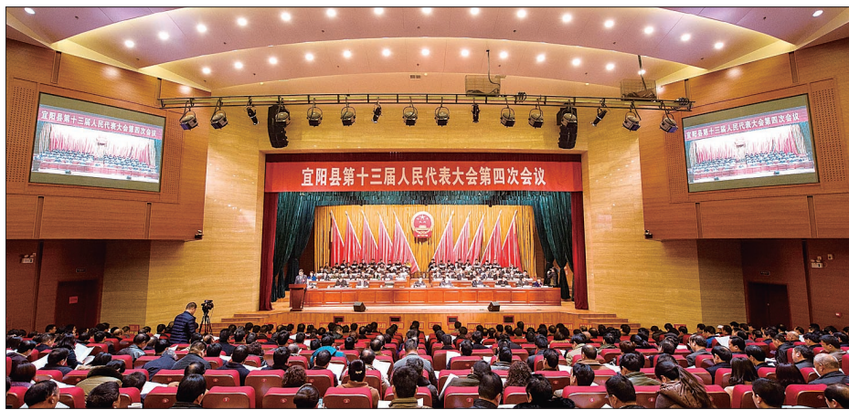
宜阳县十三届人大四次会议现场

优化结构是可持续发展的根本。 宜阳县在全力稳增长的同时,着力转方式、调结构、提质量、增效益,既为县域经济发展提供了新支撑,又为下一步发展拓展了新空间。在产业集聚区实施路、电、水、气、暖等10个配套设施项目,完成投资8.3亿元;全年完成