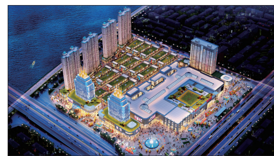
迪尼斯欢乐购物城整体效果图