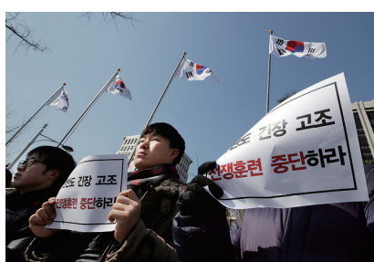
2日,在韩国首尔的政府大楼前,手持标语的示威者参加反对韩美联合军演的集会

“秃鹫”演习则以野外机动训练为主,有3700余名美军和20多万名韩军参加,将进行到4月24日。韩国海军一