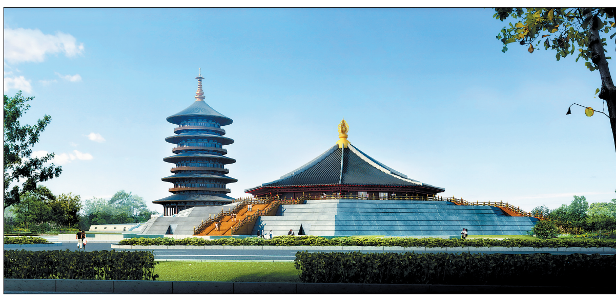
隋唐洛阳城国家遗址公园明堂景区提升改造项目效果图