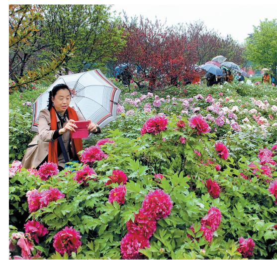
昨日,在国际牡丹园内,淅淅沥沥的春雨并未降低游客赏花热情。目前,该园早开品种牡丹盛开