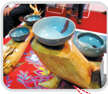
小茶具背后的 新安瓷 昌盛史

“舌尖上的洛阳”让人留恋,“笔尖上的洛阳”同样让人印象深刻。“洛阳彩绘娃娃”系列手工彩绘玩偶,包括“典故娃娃”“牡丹娃娃”“历史娃娃”“民俗娃娃”“汉字娃娃”等5个系列,提取龙门、二程、河图洛书、“纸贵”、鼎、丝路、运河、著名牡丹品种、豫剧、大鼓等具有代表性的洛阳文化符号进行再创作,力求展现洛阳特色。