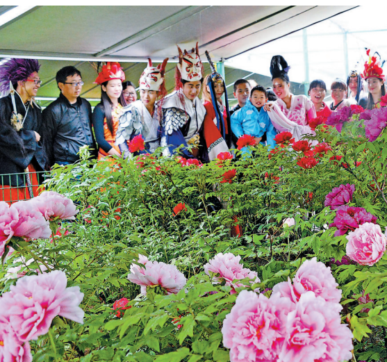
昨日,在中国国花园内,“洛神”在众侍卫的簇拥下,来到各色牡丹旁与游客共同赏花、互动、留影