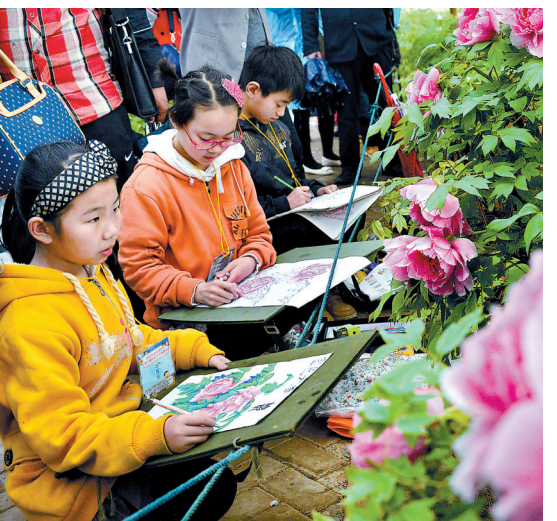
昨日,在隋唐城遗址植物园内,几名小朋友正聚精会神地画牡丹。当天,第十届万人小手画牡丹活动举行