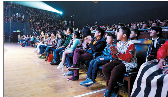
观众看戏目不转睛