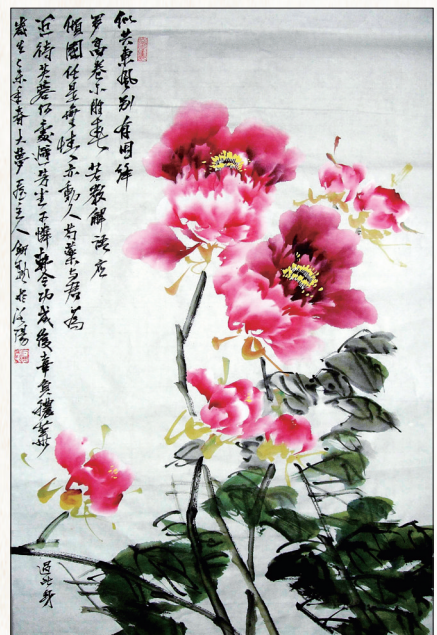
罗隐诗意图 聂剑帆画

缙(gōu)山是偃师名山,是牡丹的原生地之一,牡丹名花“金系腰”就出自该山之中。缙山之麓的灵泉寺,是千年名刹,在唐末五代时,该寺牡丹非常著名。偃师市高龙镇高崖村为波斯王陵区,也是牡丹传统种植区。