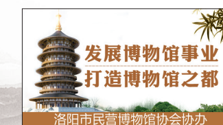
发展博物馆事业 打造博物馆之都 洛阳市民办博物馆协会协办

王羲之之行书中最有代表性的是《兰亭序》,被誉为“天下第一行书”。该帖情文并茂,心手合一,气韵生动,被历代学者奉为学习行书的典范。