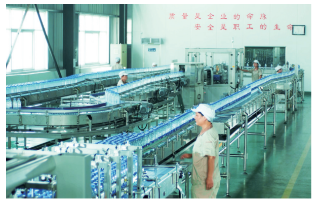
车间采用流水线作业

一道工序到走向市场的最后一个环节,河南省德润饮品有限公司都严把产品质量关,不断健全完善产品检测体系。走进生产车间,首先进入视野的是“严谨思考、严密操作、严格检查、严肃验证”的生产规章,“每项操作求质量,产品质量求保障”“小问题要重视,老毛病要根治”等生产标语随处可见,加上干净明亮的环境,严谨规范的操作流程和精益求精的员工,让人不禁竖起大拇指。