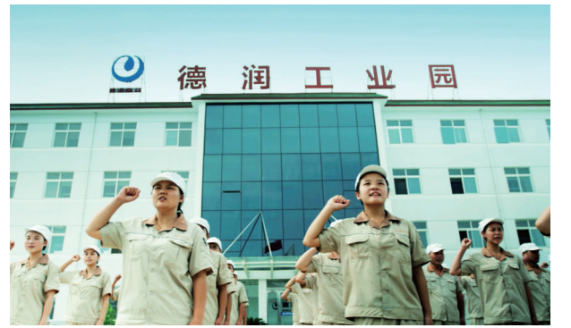
追求高质量,员工在宣誓

偏硅酸只存在于天然矿泉水中,不能以人工添加的形式加入到饮用水中。偏硅酸含量的高低,是我国鉴定天然矿泉水是否达标的重要界限指标之一。