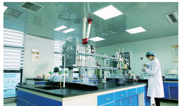
研发创新促品质提升

除拥有泉中泉的高品质水源优势外,河南省德润饮品有限公司还在浙江、福建、云南、广西、长白山等地建立3000多亩的原料种植基地,种植核桃、葛根、山菊花、各类果品等绿色无污染原料植物。