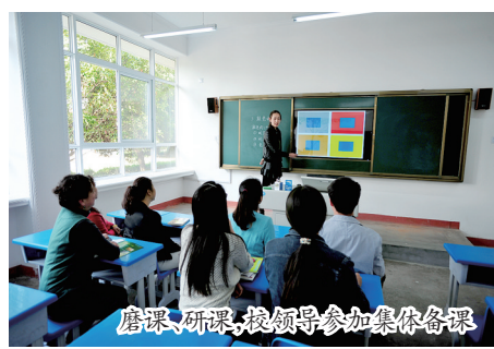
磨课、研课,校领导参加集体备课