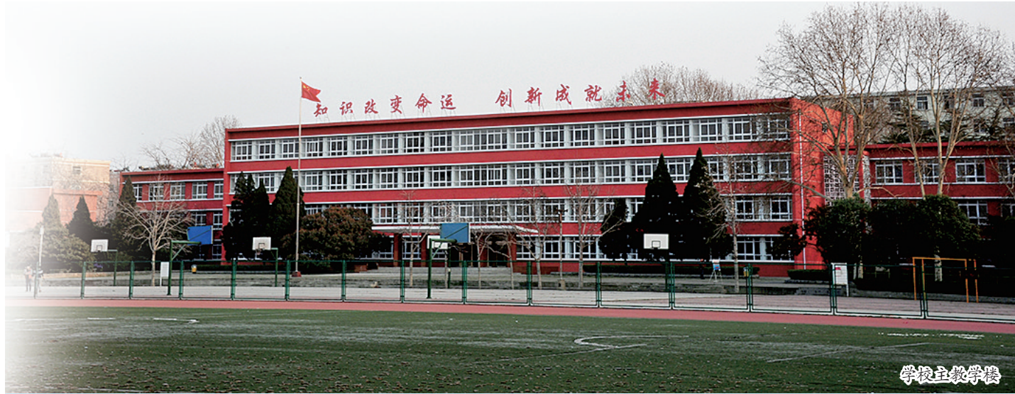
洛阳东方双语实验学校(市东方二中南校区)是洛阳市教育局批准设立的一所全日制寄宿学校,位于洛阳市涧西区龙鳞路99号,距郑卢高速公路孙辛站出口仅1公里。该校依托东方二中(原拖二中)的优质资源和先进理念,传承企业办学的优良作风,南校区各项工作与校本部做到“四个统一”,即教育教学统一管理、师资队伍统一调配、教研活动统一开展、学生活动统一部署,全力打造雅致、优质、精致的精品教育,为孩子插上翱翔的翅膀。

在东方双语实验学校,体验式教学与传统教学有机结合,以学定教的高效课堂正备受青睐。教师们早已达成共识:以学定教,就是以人为本,充分尊重学生,确立真正的学生立场,关注学生的课堂所得,让学生爱上课堂;因材施教,就是顺应学生的志趣、能力和认知规律,着力于学生能接受的、最需要的