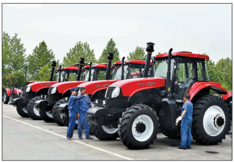
昨日,在一拖大轮拖工业园出国车停放区,一批东方红大轮拖即将出口古巴。此次一拖将向古巴出口587台东方红大轮拖,眼下正陆续交付发运