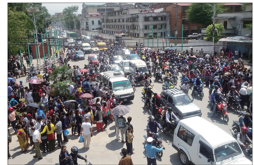
5月12日,在尼泊尔加德满都,人们在地震发生后聚集在街道上。

尼泊尔12日再次发生强烈地震,截至北京时间12日21时已造成36人死亡、逾千人受伤。随着更多信息汇总,伤亡人数可能进一步增加。据中国地震台网测定,本次地震震级为里氏7.5级。强震发生于中午时分,随后又发生至少5次较强余震。据了解,本次地震震中位于尼泊尔北部山区辛杜帕尔乔克,印度北部、中国西藏等地有震感。