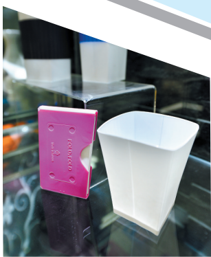
耐高温、可重复使用的折折杯