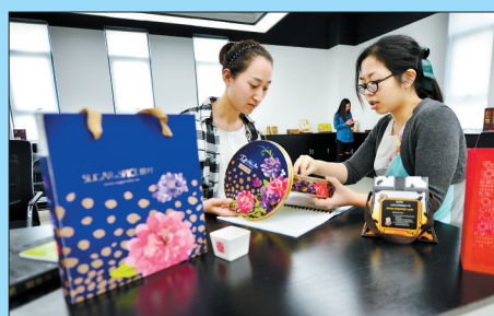
两位设计师正在讨论产品包装设计