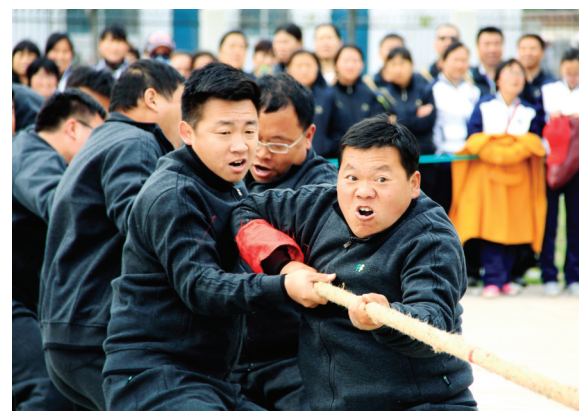
拼 李肖坤 摄