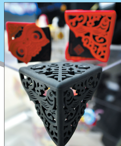
祥云造型的桌角保护套