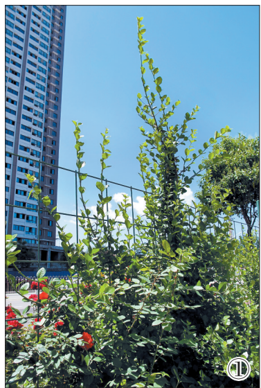
①向上攀爬的绿植 ②道北五路花团锦簇 ③道北五路上的竹篱笆花墙

近日,不少市民途经九都西路、中州西路、道北五路等道路时,感受到一种别样的美:路旁红花绿叶与支撑物交缠爬绕,像长长的花墙。这是我市近年尝试的一种新型道路垂直绿化方式,经过两年的生长、建设,目前不少道路垂直绿化效果初显。