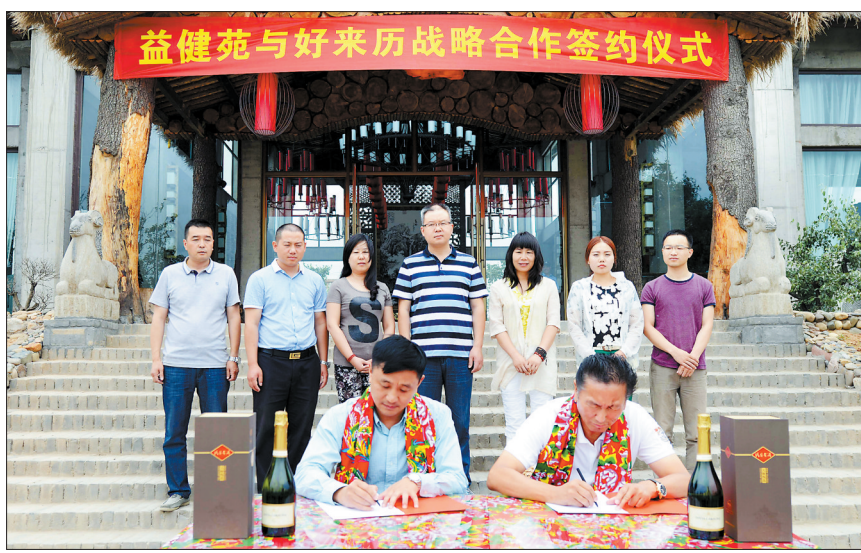
好来历与益健苑签订战略合作协议