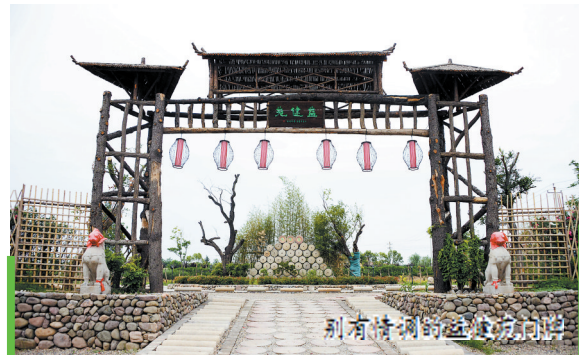
别有特色的庄园大门

在当今这个充满压力、快节奏的生活环境里,益健苑为大家提供了一个放松身心、亲近自然、坚持绿色生态无污染的地方。 谢娜娜/文