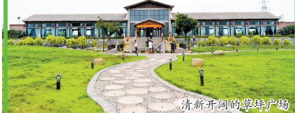
清新开园的草坪广场