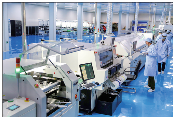
中信重工高端电液智能装备制造基地