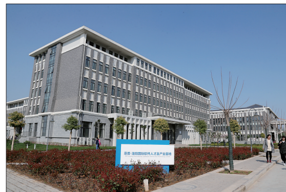
惠普-洛阳国际软件人才及产业基地(资料图片)