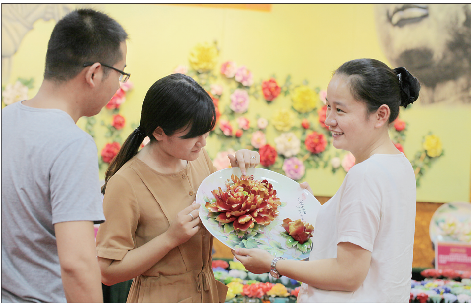
洛阳牡丹瓷股份有限公司牡丹瓷产品备受顾客青睐

城、隋唐城遗址等诸多世界历史文化资源的优势，积极研究、策划、包装、推进一批有洛龙区域文化特色的项目，着力打造底蕴厚重、特色鲜明、在全国有影响力的文化旅游名区。