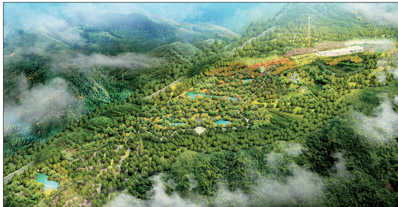
西苑文化森林公园鸟瞰图

近年,高新区按照市委、市政府的决策部署,全力推进林业生态圈建设,生态高新呼之欲出。