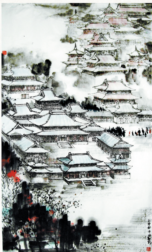
大唐都亭驿 聂剑帆画

大街路北第一坊,其位置在今洛阳老城大街西段以北区域。《旧唐书·封常清传》说,安史叛军入洛阳,封常清“战于都亭驿,不胜,退守宣仁门,又败”。可见都亭驿与宣仁门甚近,宣仁门是东城的东门,遗址在老城十字街西40米,由于宣仁门外有写口渠,是通往含嘉仓的一条运河,河道较宽,应不窄于80米。因此,都亭驿的确切位置应在老城十字街东北角。都亭驿是一个庞大的建筑群。它由厅、楼、亭、台、榭等各类建筑组成,有宏大的山门,门外有大型广场。