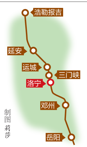
豪华铁路洛宁西站大致位置

该铁路建设工期为5年,洛宁西站选址位于洛宁县西子湖畔。按照豪华铁路建设工作部署,整体建设工作计划今年9月1日全线启动,其中洛宁县需征地390亩、临时用地370亩。洛宁县提前开展征地建设工作,目前已就临时用地、乡村道路使用、红线征地和房屋拆迁、施工环境保护等工作进行了详细部署。