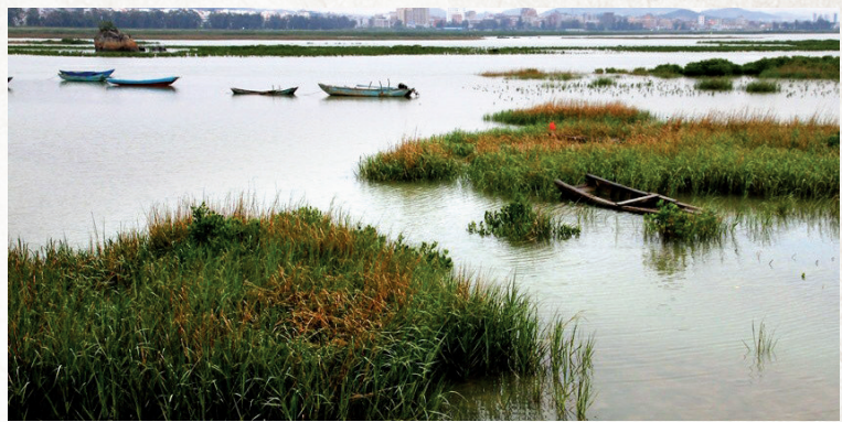
泉州洛阳江