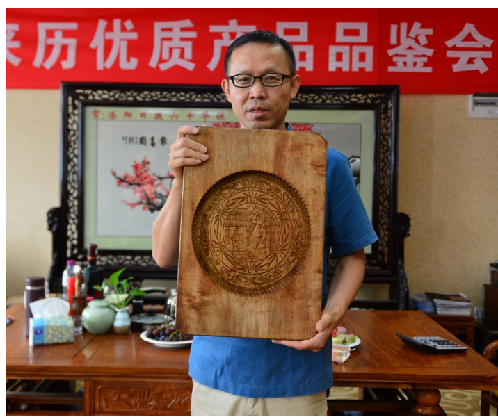
热心市民携老物件儿参加展览