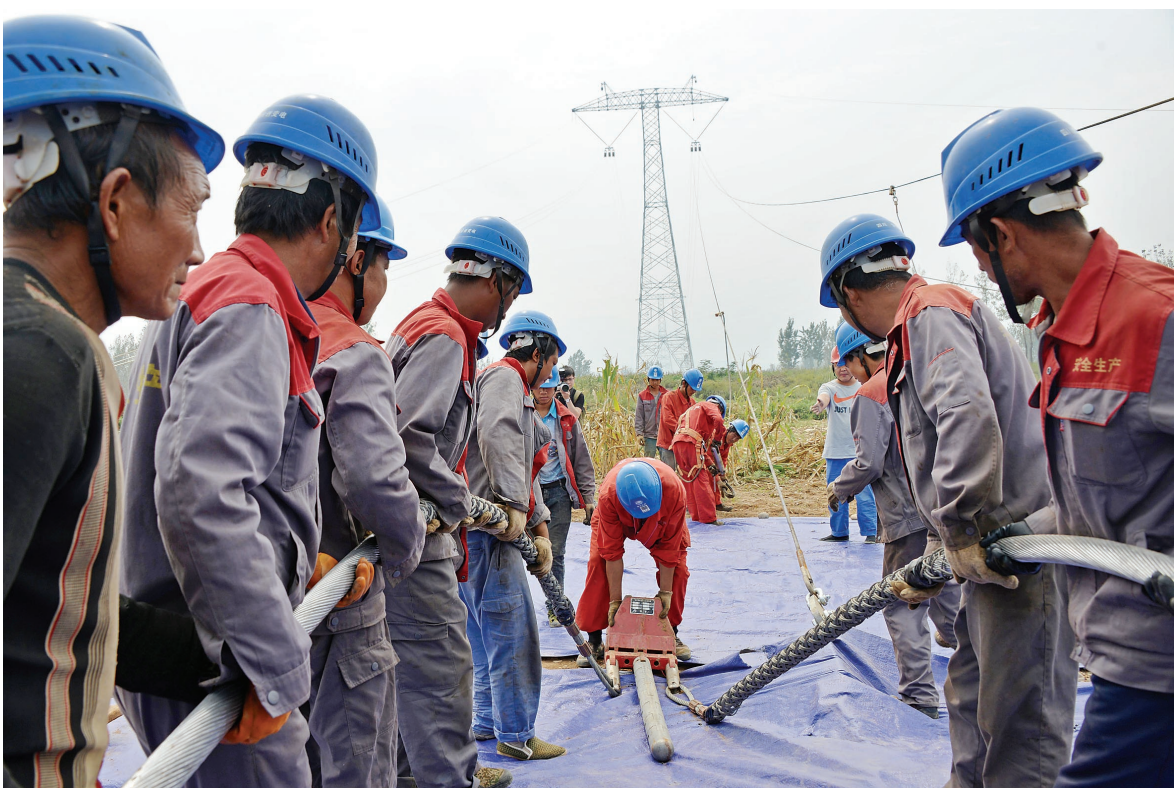
粗大的输电线需要多人合抬