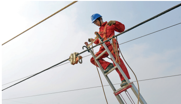
安装引线牵引装置