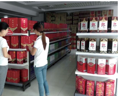
店员为消费者介绍酒品