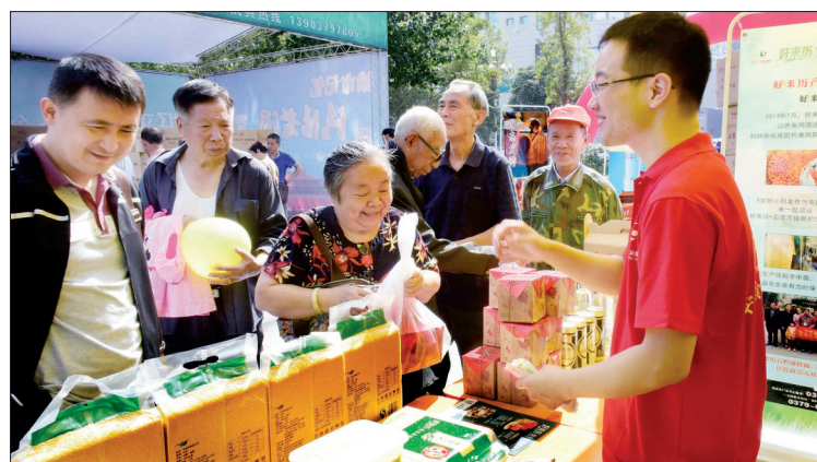
市民在周王城广场踊跃购买好来历产品

核心提示:近来,由于好来历月饼全城热销,可能您的订单我们无法及时派送。感谢您的谅解,并请您与我们随时保持联系。