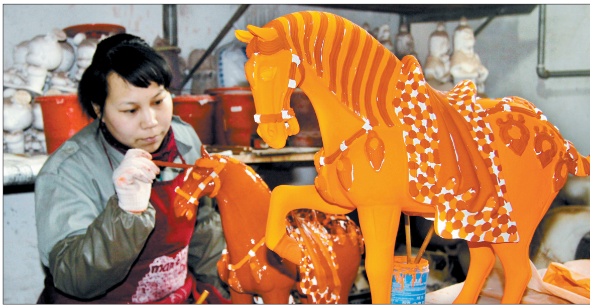
色彩饱满绚丽的唐三彩

平乐镇把牡丹画作为文化主导产业来抓,建起了占地95亩,包括美术馆综合楼和158套画家创作公寓的牡丹画创意