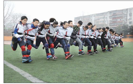
市直二小代表队团队劲跑赛

本报讯(见习记者 李梦龙 特约通讯员 石智卫)27日至昨日,央视《极速少年——中国小学生30人31足团队劲跑大会》摄制组来洛拍摄节目,由我市市直二小学生组成的代表队将作为我省两支参赛队伍之一,于近期赴京角逐“极速少年——30人31足团队劲跑大赛”全国总冠军。