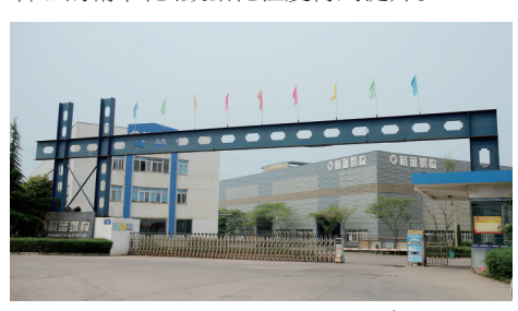
河南杭萧厂区大门

河南杭萧引入了以色列高德拉特机构“TOC”管理法,确定了满足业主诉求的“短交期、准交期”战略;实施了“ERP”系统管理、“TPM”生产管理、“BIM”技术管理、“CCPM”工程管理,使产品的精细化、施工的流程化、管理的精准化、数据化程度得到提升。