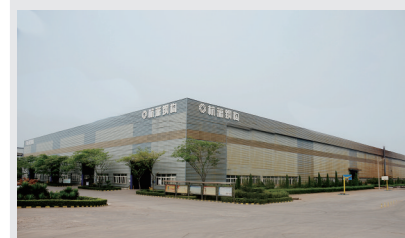
河南杭萧生产厂区

位于洛阳飞机场工业园区的河南杭萧钢构有限公司(简称“河南杭萧”),是一家集钢结构建筑设计、制造、安装于一体的钢结构企业。该公司成立于2001年,注册资金3200万元,工厂占地146亩。经过14年的努力,河南杭萧现已发展成为河南省百强企业、高新技术企业,洛阳市优秀民营企业、高成长型企业和洛阳市“小巨人”企业。目前,河南杭萧拥有职工450名,其中技术人员68名;拥有国内、国外先进的钢结构加工设备,钢结构年加工能力10万吨;一期生产车间建筑面积2.5万平方米,二期生产车间建筑面积2.6万平方米。