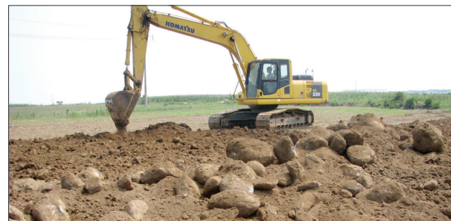
上图 大型机械在孟脑村挖地下的石头