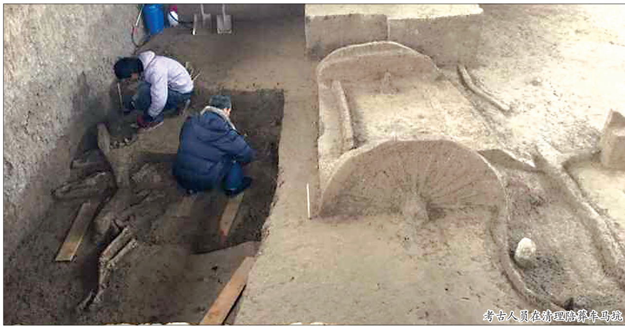
考古人员在清理陪葬车马坑

“虽然墓葬看不到任何戎族文化的痕迹,但车马坑里的牛羊头蹄带有典型的戎人特征,而且这支戎人已经对周文化高度认同,受周文化影响很大。”信立祥说。