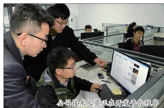
公司技术人员正在开发平台程序

布局互联网金融，洛阳城投集团已迈出成功一步，“金财动力”的持续发展，将为我市城市建设打通“输血管道”，助力洛阳社会经济发展。