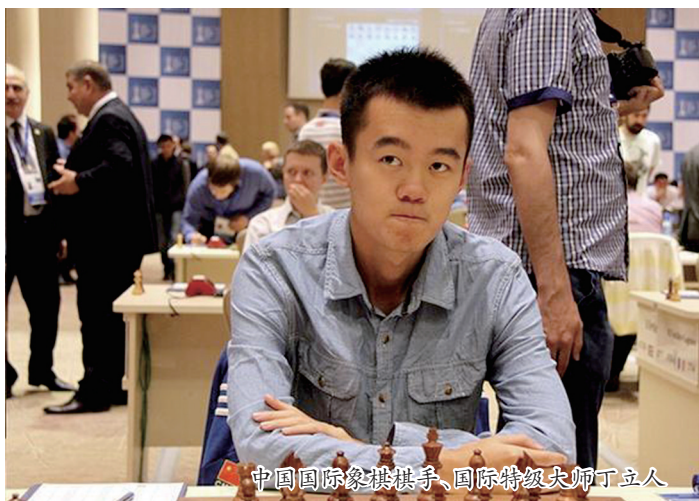
中国国际象棋棋手、国际特级大师丁立人

洛阳棋坛喜迎年度巅峰盛事——“中弘杯”洛阳首届国际象棋公开赛将于12月19日盛大举行。届时中国国际象棋棋手、国际特级大师丁立人应此次主办方之一的中弘卓越集团邀请,将亲临比赛现场,与广大洛阳棋友手谈、交流。