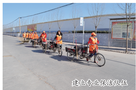
建立专业保洁队伍

“村里的道路干净了,往日脏乱难闻的污水渠和旱厕也大变样。”谈到社区环境卫生变化,龙门园区管委会龙门石窟街道办事处部庄社区的村民们都有这样的感受。 近年,龙门石窟街道办事处为解决辖区背街小巷和农村环境脏乱差、基础设施不完善等问题,始终以高标准要求,攻坚克难,扎实推进创新管理、防治结合的整治模式,环境卫生治理工作取得实效。在今天的全市背街小巷环境卫生管理工作评比中,龙门石窟街道办事处获得第二名的好成绩,被评为“2015年度全市背街小巷环境卫生管理工作先进单位”。