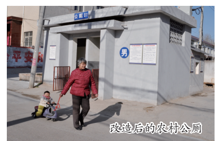
改造后的农村公厕

“背街小巷和农村环境卫生整治关系到社区居民的切身利益,我们将坚持不懈地抓好这项工作,巩固成效,提高标准,针对薄弱环节积极整改落实,给居民营造一个绿色、健康、舒心的宜居环境。”陈相社说。 本报记者 牛鹏远 通讯员 常江涛/文