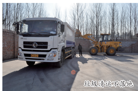
垃圾清运不落地的垃圾车