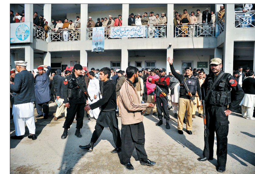
在巴基斯坦贾尔赫达,发生袭击事件后警察和民众聚集在医院前

袭击发生后,包括巴军方和警察在内的大量安全人员被部署到该大学,军方还派遣了三架军用直升机到现场指挥行动。学生和教职员被紧急撤离到安全地带。截至目前,还没有关于袭击者劫持人质的报道。