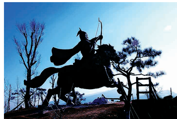
射 清弘 摄

请作者老铁、清弘将个人通信地址和联系方式发至lyrbshb@163.com,以奉薄酬。