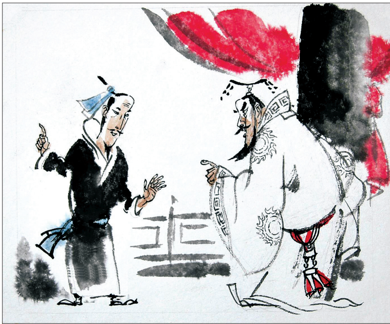
孟子见梁惠王 插图 李玉明

隋文帝时,岐州刺史梁彦光治政宽仁,“合境大化”,政绩天下第一;后来转任相州刺史,沿袭岐州经验行政,但相州民风诡诈,蔑视政令,给他起了个绰号“戴帽伤(比喻软弱无能)”,讽刺他懦弱无能,文帝听说后罢其官。一年后,文帝打算起用梁彦光为赵州刺史,而他自告奋勇再入相州,“改弦易调,变其风俗”,文帝嘉其精神,准其请。梁彦光二进相州,以霹雳手段打击犯罪,狡猾之徒纷纷潜窜,合境惊骇;接着普及教化,每乡设立学校,聘请山东大儒讲授圣贤之书,人民感悦,耻于争讼,风俗大改。梁彦光两治相州而效果迥