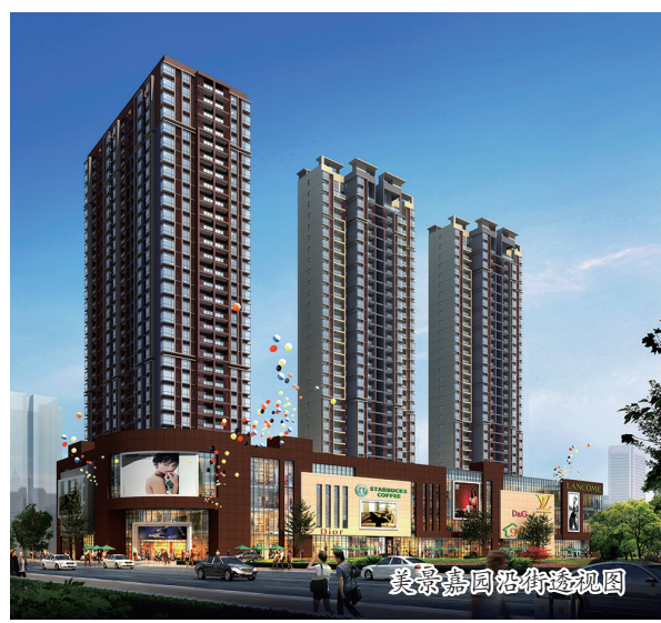
美景嘉园沿街透视图

水养生、景养心。 美景嘉园，洛河北岸绝版风景住宅区之一，临河观景，距洛河直线距离168米。与我市超大城市绿化带——洛浦公园仅一路之隔，自然天成绿色氧吧。住在这里，无论是波光粼粼的洛河、还是斑斓的洛浦夜景，全都一览无余。