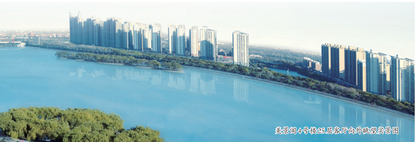
美景阁4号楼25层客厅向外眺望实景图