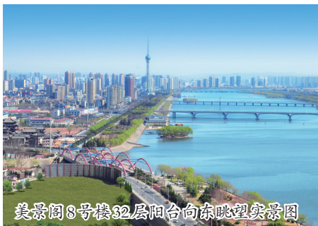
美景阁8号楼32层阳台向东眺望实景图