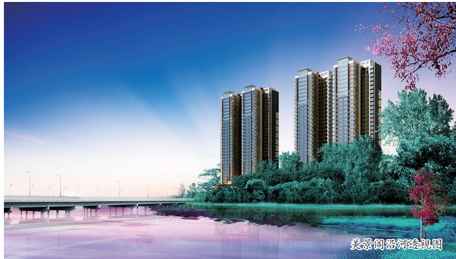
美景阁沿河透视图