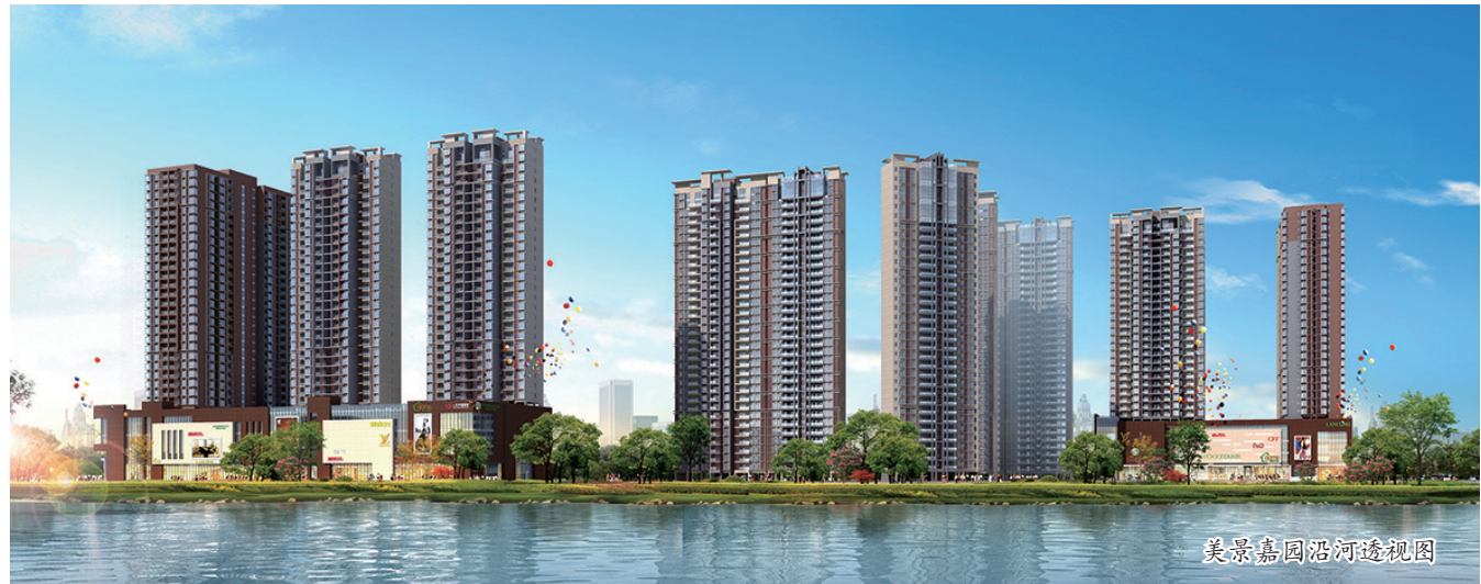
美景嘉园沿河透视图

专线64625111/222。 望有置业需求的客户，前往涧西区丽新南路美景嘉园营销中心进行咨询。（梁文 文/图）