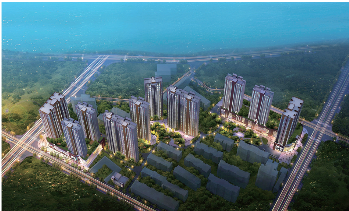
美景嘉园夜景鸟瞰效果图

饮一条街 阳光别墅：率先打造的洛阳市亲水临河超低密度别墅群 碧水云天：洛阳市率先打造的高层看河住宅项目 君临天下：洛阳市建筑高度超百米户户观河的高层产品 美景阁：洛阳市直线距离与洛河最近的滨河豪宅 ..... 滨河健康地产创领者——嘉禾置业，善待您的一生！