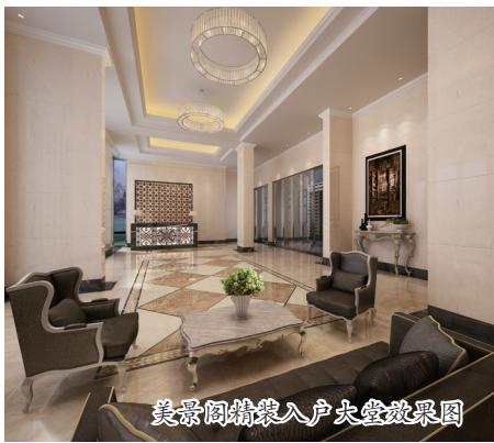
美景阁精装入户大堂效果图