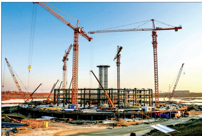
2月8日(大年初一),牡丹剧院建设工地上一片繁忙景象

“这么冷的天,干活有啥困难?”记者问。“没啥困难,就是有时候手冻硬了,工作使不上劲。”董师傅说,“这个项目领导