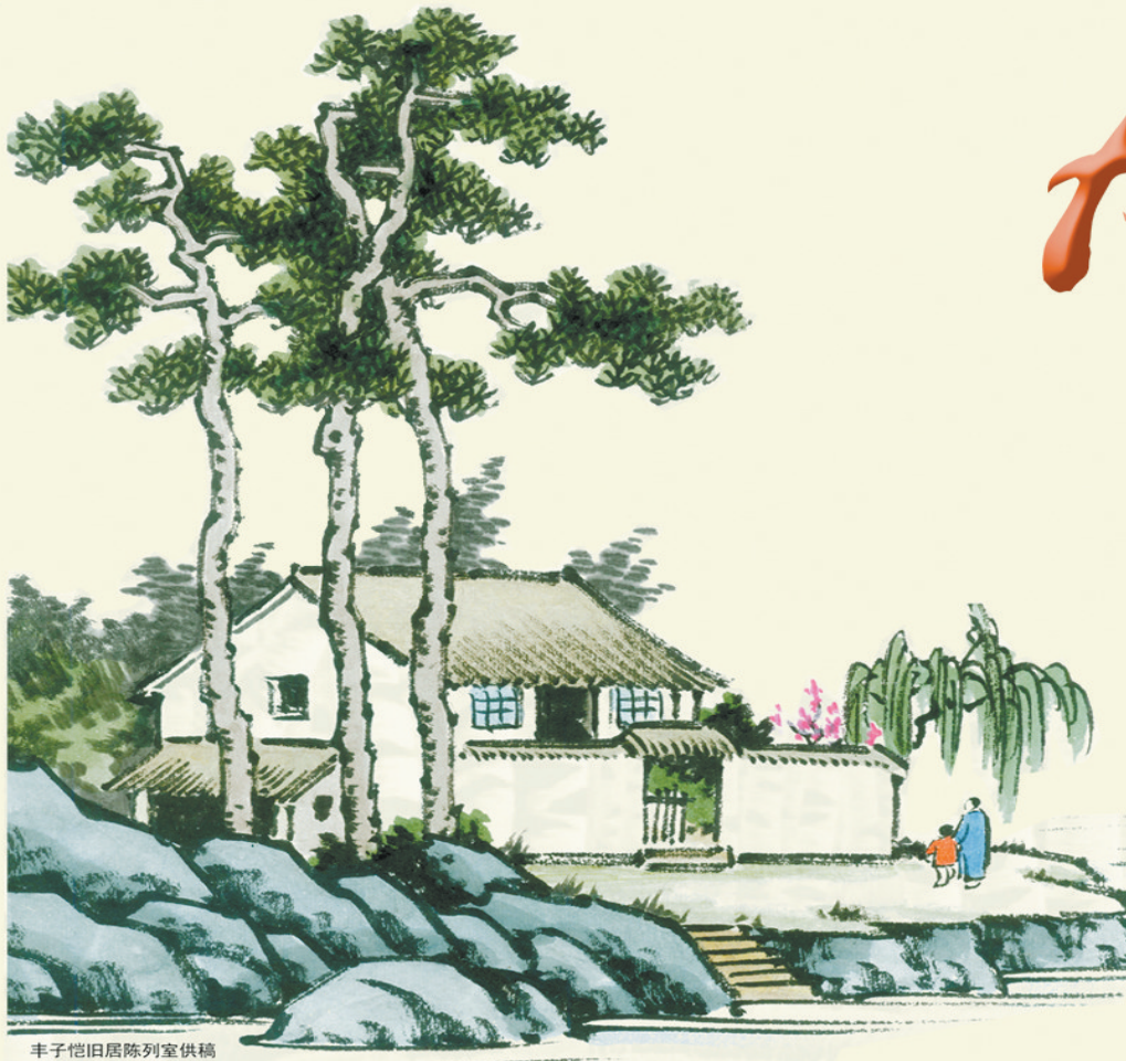
丰子恺旧居陈列室供稿