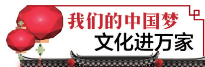
我们的中国梦 文化进万家

日前,洛阳市老城区政协书画院在市美术馆举行成立仪式。“厚重老城”首届书画作品展同时开展,共展出寇北辰、王鸣等数十位名家的250余幅书画作品。本次展览在老城区文化馆设有分展,分展将持续一个月,市民可免费观展。