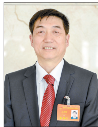
加快构建、完善和提升现代产业体系,对我市经济社会发展具有重大引领带动作用。今年市政府工作报告提出,我市要培育壮大战略

性新兴产业,围绕新能源及新能源汽车产业,支持骨干企业突破核心技术,扩大优势产能。