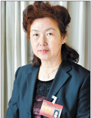
“加快构建文化传承创新体系,对整个社会的物质文明和精神文明协调发展非常重要。”市政协委员、