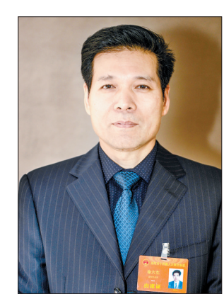
民营经济是支撑现代创新体系、现代产业体系和现代市场体系的重要载体,业已成为我市经济主体最主要、最活跃的组成部分,在拉

动经济增长、优化产业结构、推动科技创新、促进就业创业等方面发挥着不可替代的作用。然而民营企业特别是中小企业,依靠银行贷款融资的渠道一直“有点堵”,影响企业的发展。