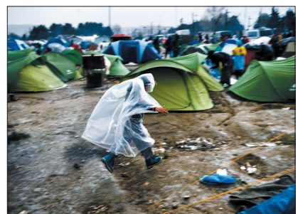
3月7日,一名难民儿童张开双臂在临时难民营中奔跑