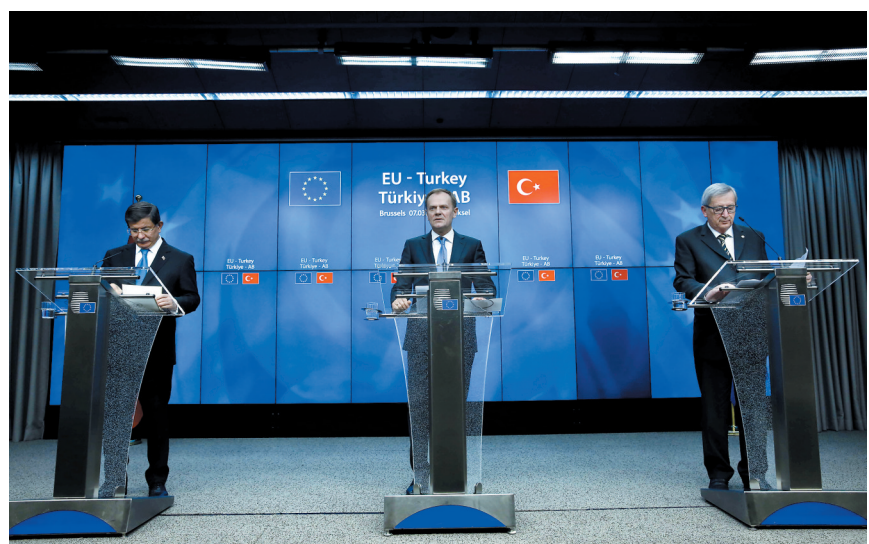
3月8日,在比利时首都布鲁塞尔欧盟总部,欧洲理事会主席图斯克(中)、欧盟委员会主席容克(右)与土耳其总理达武特奥卢出席新闻发布会

土耳其从希腊每接收一名“叙利亚人”,欧盟就将安置一名来自土耳其的叙利亚难民。欧洲国家正遭受二战以后最大难民潮冲击。难民多数来自战乱的叙利亚、伊拉克和阿富汗。不过,欧盟认定许多人并非难民,而是希望改善生活条件的非法移民。 超过100万难民和移民去年涌入欧洲,多数从土耳其取道希腊,再由巴尔干国家进入富裕的西欧和北欧。欧盟去年与土耳其达成协议,承诺提供30亿欧元,帮助土方安置叙利亚难民。欧盟和土耳其还同意,阻止“不符合国际人道主义救助标准”的人流入欧洲国家。另一方面,土耳其向欧盟提出多种条件以帮助阻挡难民潮,包括加快土耳其加入欧盟的谈判。 达武特奥卢向欧盟领导人提出,欧盟3年内应向土耳其再提供30亿欧元用于安置难民;最晚6月给予土耳其公民免签待遇,比原计划提前数月。 在8日发表的原则性协议中,欧盟同